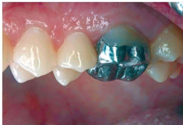
Prótese – Metálica