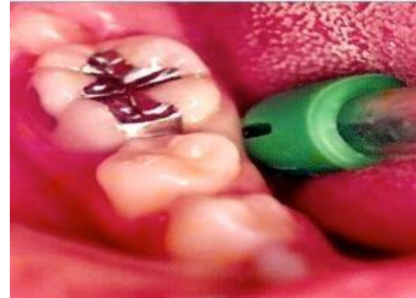
Restauração – Amálgama