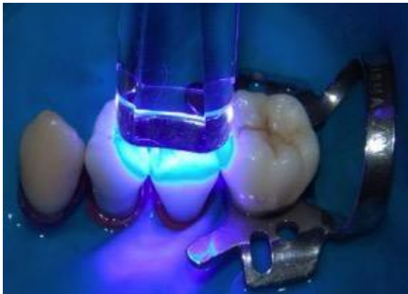
Restauração – Resina