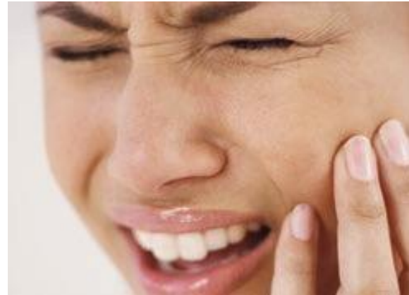
Urgência dia e noite