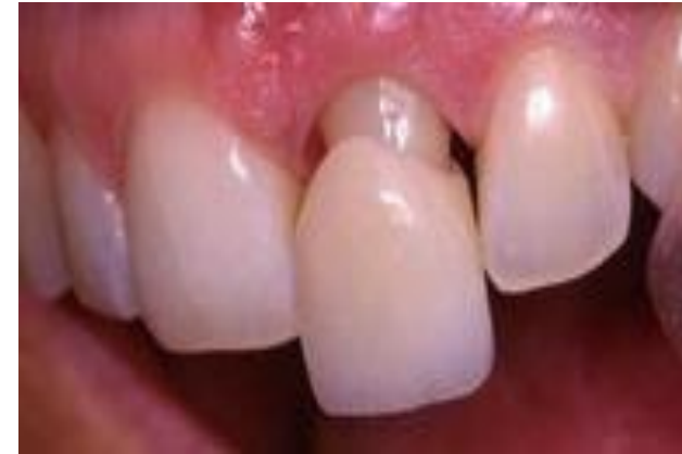
Prótese – Cerômero